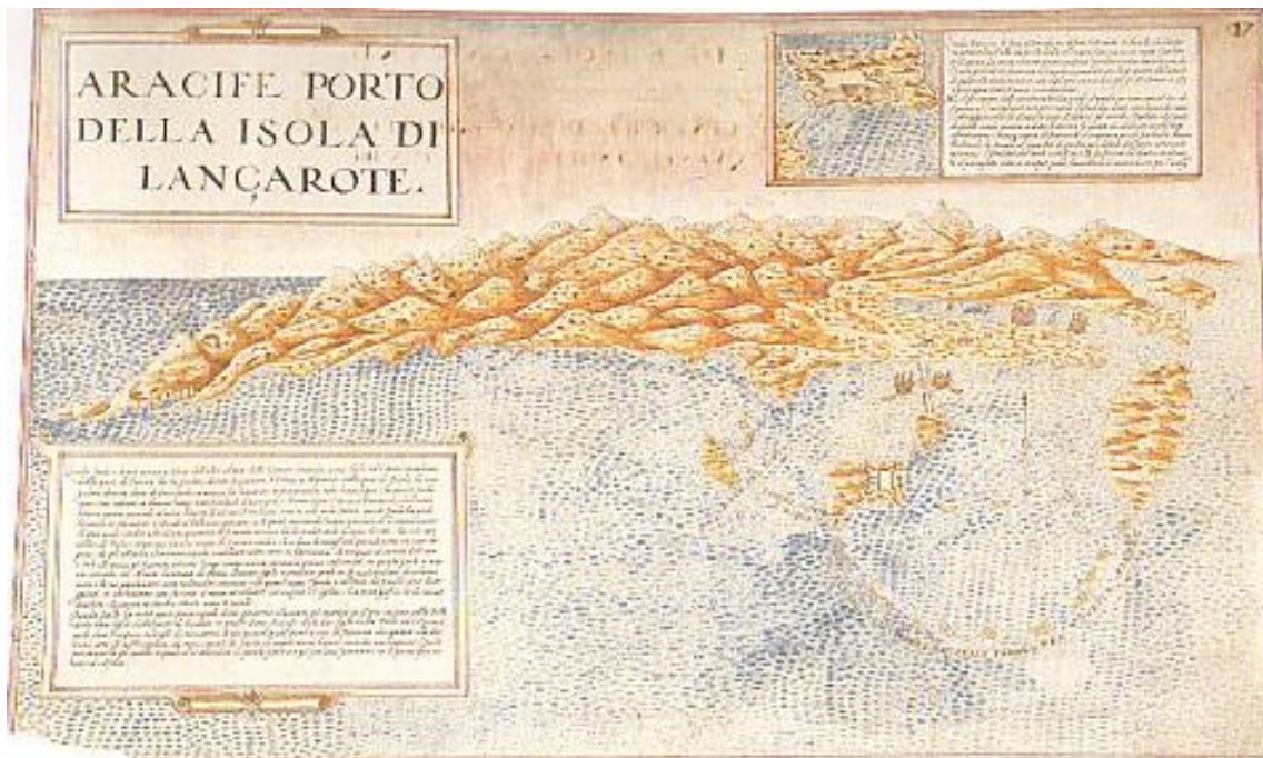
Arrecife de Lanzarote según Leonardo Torriani (1587-1593)

ADAPTACION AL PROGRAMA SECTORIAL PARA LA POTENCIACION DE Z.C.A. DE CANARIAS 2010-2013